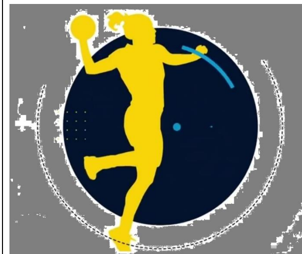
CLUB DE BALONMANO CENTROMURCIA CARTA DE SERVICIOS 2019/20