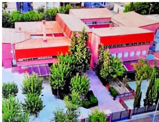
CLUB DE BALONMANO CENTROMURCIA